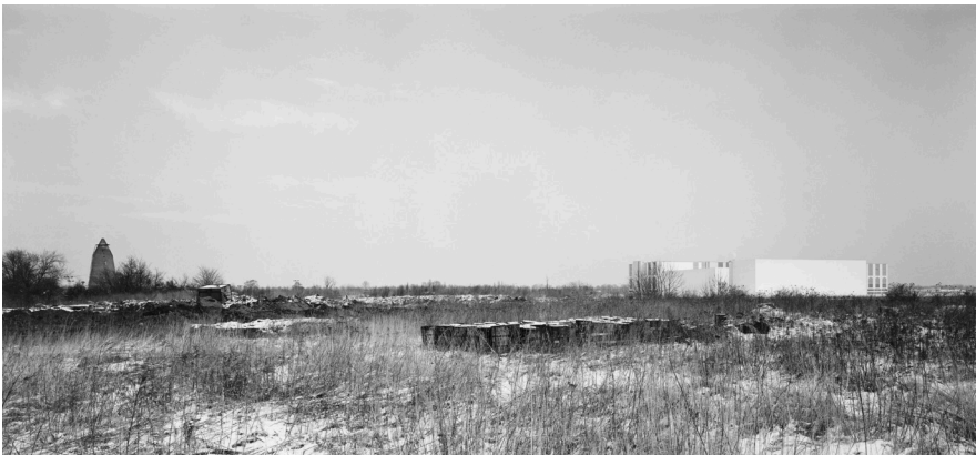
André Kirchner, West, Falkensee, Munitionsbunker, Müllkippe und neue Herlitz-Zentrale vor Albrechtshof. Aus der Serie: Stadtrand Berlin 1993/94