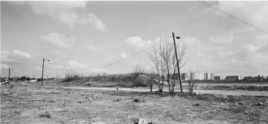
André Kirchner, Süd, Schönefeld, ehem. Grenzkontrollpunkt an der Waltersdorfer Chaussee, Blick nach Altglienicke. Aus der Serie: Stadtrand Berlin 1993/94