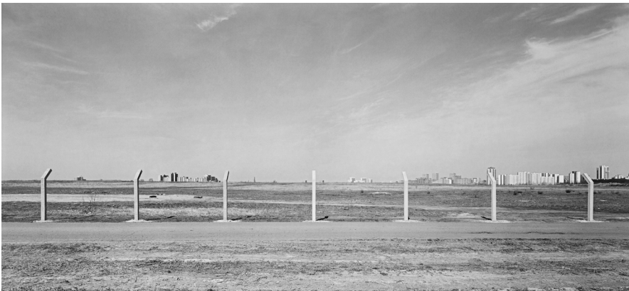
André Kirchner, Süd, Großziethen, Bauerwartungsland vor Buckow. Aus der Serie: Stadtrand Berlin 1993/94