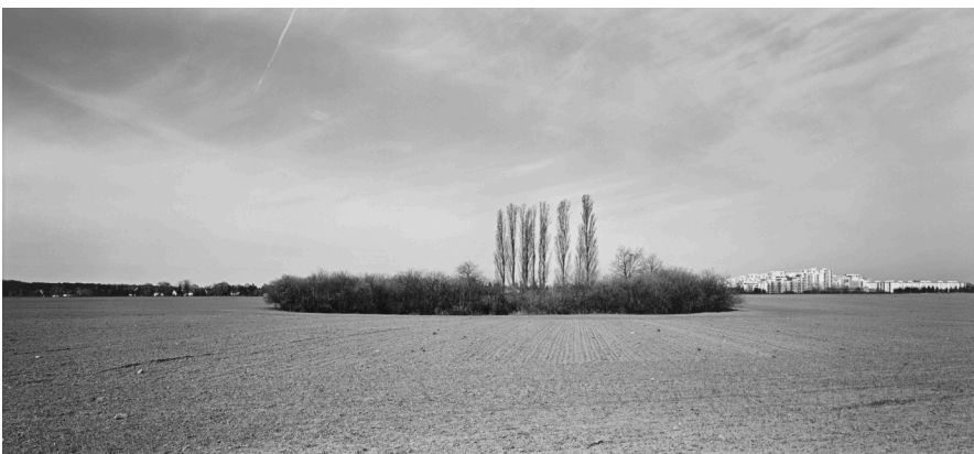
André Kirchner, Süd, Kleinziethen, Felder östlich von Lichtenrade. Aus der Serie: Stadtrand Berlin 1993/94, © André Kirchner, Repro: Anja Elisabeth Witte