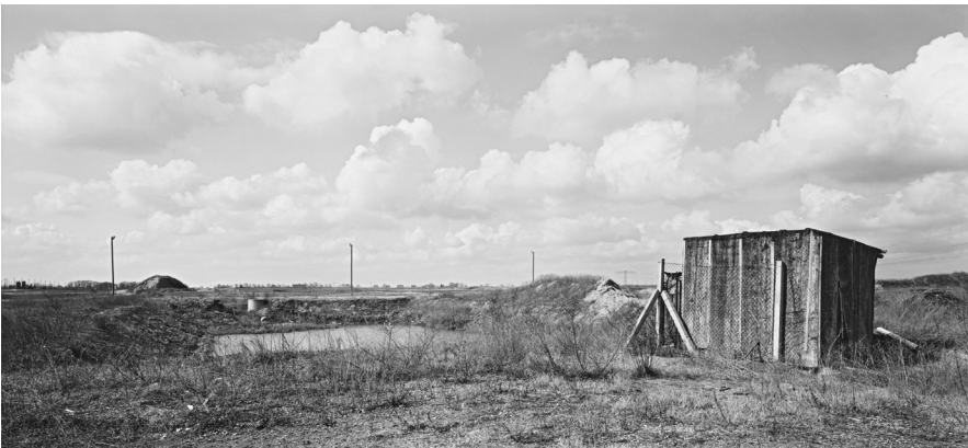
André Kirchner, Süd, Schönefeld, Teich nördlich des Bahnhofs. Aus der Serie: Stadtrand Berlin 1993/94, © André Kirchner, Repro: Anja Elisabeth Witte