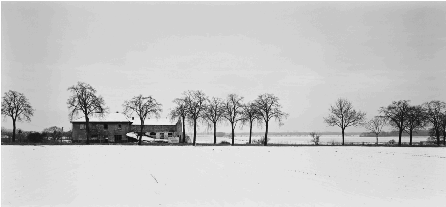
André Kirchner, West, Dallgow, ruiniertes Gasthof an der B5. Aus der Serie: Stadtrand Berlin 1993/94