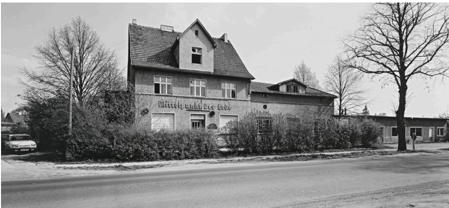
André Kirchner, Ost, Hellersdorf, leerstehender Gasthof an der Mahlsdorfer Straße vor Hönow. Aus der Serie: Stadtrand Berlin 1993/94, © André Kirchner, Repro: Anja Elisabeth Witte