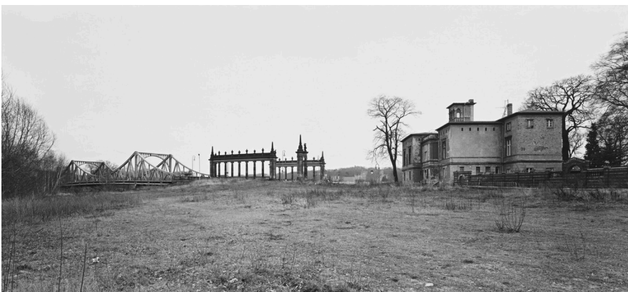
André Kirchner, West, Potsdam, Berliner Vorstadt, Glienicke Brücke, ehem. Kontrollpunkt - Brücke der Einheit. Aus der Serie: Stadtrand Berlin 1993/94