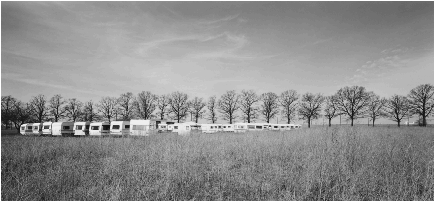
André Kirchner, Süd, Großziethen, an der Rudower Chaussee. Aus der Serie: Stadtrand Berlin 1993/94