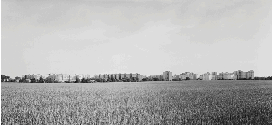
André Kirchner, Nord, Lübars, Am Alten Bernauer Heerweg vor dem Märkischen Viertel. Aus der Serie: Stadtrand Berlin 1993/94, © André Kirchner, Repro: Anja Elisabeth Witte