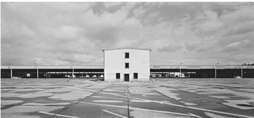
André Kirchner, Süd, Dreilinden, ehem. Grenzkontrollpunkt Drewitz, 13,5 ha Betonfläche über früherer Müllkippe. Aus der Serie: Stadtrand Berlin 1993/94