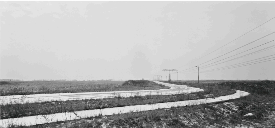
André Kirchner, Süd, Schönefeld, nicht kartierte Grenzstraße vor Rudow. Aus der Serie: Stadtrand Berlin 1993/94, © André Kirchner, Repro: Anja Elisabeth Witte