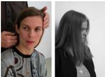
Doppelbilder: Heidi Specker, S.B. und T.T., aus der Serie IN FRONT OF, 2015, © Heidi Specker / VG BILD-KUNST Bonn, 2016