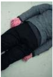
Heidi Specker, R.R.R., aus der Serie IN FRONT OF, 2015, © Heidi Specker / VG BILD-KUNST Bonn, 2016