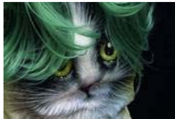
Heidi Specker, Katze, aus der Serie IN FRONT OF, 2015, © Heidi Specker / VG BILD-KUNST Bonn, 2016