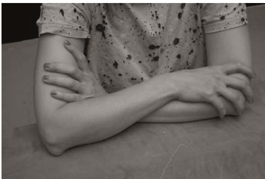
Heidi Specker, H.B., aus der Serie IN FRONT OF, 2015 © Heidi Specker / VG BILD-KUNST Bonn, 2016

In der Fotografieausstellung IN FRONT OF werden zwei sehr unterschiedliche Werkgruppen der Berliner Fotografin Heidi Specker gezeigt: ihr aktuellstes Projekt IN FRONT OF mit ihrer bisher wohl wichtigsten Arbeit IM GARTEN – prämiert mit dem Stipendium der Villa Massimo und noch nie als Ganzes ausgestellt.