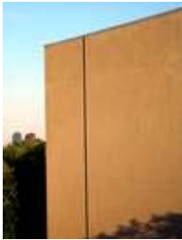
Heidi Specker, Tiergarten, aus der Serie: IM GARTEN, 2003, © Heidi Specker / VG BILD-KUNST Bonn, 2016