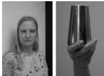
Doppelbilder: Heidi Specker, H.B. und Türke, aus der Serie IN FRONT OF, 2015, © Heidi Specker / VG BILD-KUNST Bonn, 2016