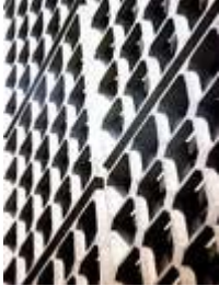
Heidi Specker, Eiermann, aus der Serie: IM GARTEN, 2003, © Heidi Specker / VG BILD-KUNST Bonn, 2016