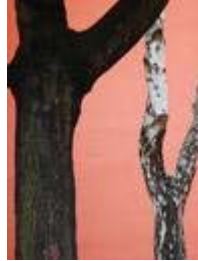
Heidi Specker, Schulhof, aus der Serie: IM GARTEN, 2003, © Heidi Specker / VG BILD-KUNST Bonn, 2016