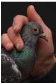
Heidi Specker, Taube, aus der Serie IN FRONT OF, 2015, © Heidi Specker / VG BILD-KUNST Bonn, 2016