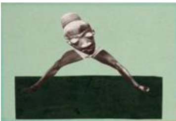
Hannah Höch, Ohne Titel (Aus einem ethnographischen Museum), 1929 © VG BILD-KUNST Bonn, 2016

Pressekonferenz: 03.08.2016, 11 Uhr, Eröffnung: 04.08.2016, 19 Uhr