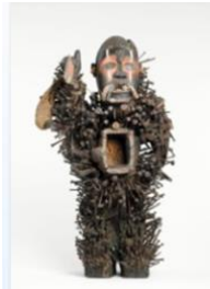
Künstler unbekannt, Kraftfigur, nkisi n'kondi, vor 1892, Vili, Loango, Dem. Republik Kongo, Musée du quai Branly, © erloschen, Foto: bpk / RMN – Grand Palais (Michel Urtado / Thierry Olivier)