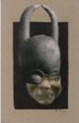
Hannah Höch, Aus einem ethnographischen Museum Nr. X, 1924/25, Berlinische Galerie, © VG BILD-KUNST Bonn, 2016, Repro: Anja Elisabeth Witte