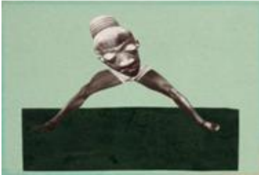
Hannah Höch, Ohne Titel (Aus einem ethnographischen Museum), 1929 © VG BILD-KUNST Bonn, 2016