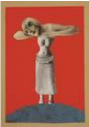
Hannah Höch, Ohne Titel (Aus einem ethnographischen Museum), 1930, Museum für Kunst und Gewerbe Hamburg, © VG BILD-KUNST Bonn, 2016