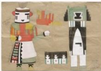
Sophie Taeuber-Arp, Entwurf für ein Katsina-Kostüm (Nr. 60), um 1922, Arp Museum Bahnhof Rolandseck, © erloschen