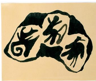
Hans Arp, Prä-Dada-Zeichnung, um 1915, Stiftung Arp e.V., Berlin/Rolandseck