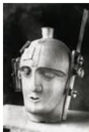
Unbekannter Fotograf, Ohne Titel (Mechanischer Kopf, 1919, von Raoul Hausmann), Neuabzug vom Original-Glasnegativ durch Floris Neusüss, Berlinische Galerie, Edition Griffelkunst, Hamburg 2002, © VG BILD-KUNST Bonn, 2016