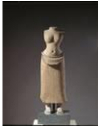
Künstler unbekannt, Torso der Göttin Uma, spätes 9./frühes 10. Jh., Kambodscha, Khmer-Reich, Museum Rietberg Zürich