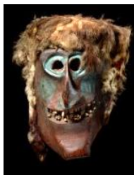
Künstler unbekannt, Hämisch grinsende Fratze, 1. Hälfte 20. Jh., Schweiz, Lötschental, Museum Rietberg Zürich, © erloschen