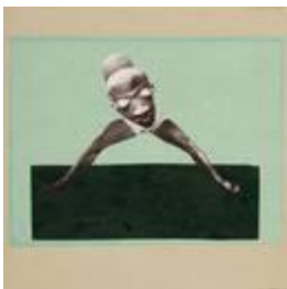
Hannah Höch, Ohne Titel (Aus einem ethnographischen Museum), 1929, Museum für Kunst und Gewerbe Hamburg