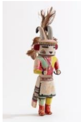
Künstler unbekannt, Bergschaf-Katsina (pangwu), um 1900, Hopi, Nordamerika Native Museum (NONAM) Zürich, © erloschen, Foto: Rainer Wolfsberger