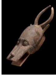
Künstler unbekannt, Helmmaske bo nun amuin, Erste Hälfte 20. Jh., Elfenbeinküste, Baule-Region, Museum Rietberg Zürich, © erloschen, Foto: Rainer Wolfsberger