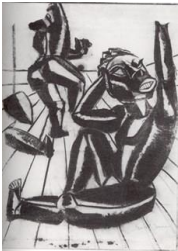
Marcel Janco, Entwurf für Dada-Plakat zur Veranstaltung „Le Chant Nègre“ vom 31. März 1916, Kunsthaus Zürich, Vereinigung Zürcher Kunstfreunde