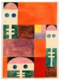
Sophie Taeuber-Arp, Abstraktes Motiv (Masken), 1917, Stiftung Arp e.V., Berlin / Rolandseck, © erloschen