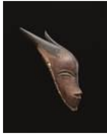
Meister von Buafle, Maske mit Hörnern, gu, 19. Jh., südliche Guro-Region, Elfenbeinküste, Museum Rietberg Zürich, © erloschen, Foto: Rainer Wolfsberger