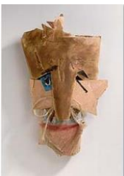
Marcel Janco, Maske, 1919, Centre Georges Pompidou Musée national d'art moderne, Paris, © VG BILD-KUNST Bonn, 2016, Foto: bpk / Centre Pompidou, MNAM-CCI