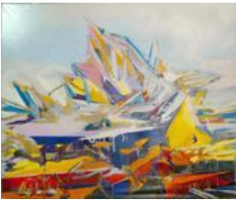
Tatjana Doll, RIP_Self Transforming Machine Elves II, 2013–2015, © VG BILD-KUNST Bonn, 2016, Repr: Bernd Borchardt