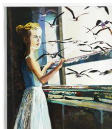
Cornelia Schleime, Ein Wimpernschlag, 2016, Privatsammlung, © Cornelia Schleime, Repro: Bernd Borchardt