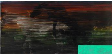
Tatjana Doll, AD_Birth in Reverse, 2013, © VG BILD-KUNST Bonn, 2016