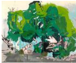
Tatjana Doll, DUMMY_Dr Bruce Banner II, 2014, © VG BILD-KUNST Bonn, 2016