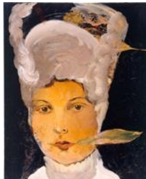
Cornelia Schleime, Selbstporträt mit Mangoblatt, 1997, Privatsammlung, © Cornelia Schleime, Repro: Udo Hesse