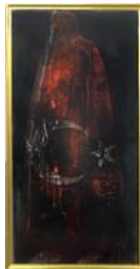
Tatjana Doll, DUMMY_Darth Vader Borderline II, 2012–2013, © VG BILD-KUNST Bonn, 2016