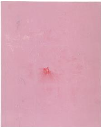
Tatjana Doll, ENAMEL_Dreaming Under Pressure, 2015, © VG BILD-KUNST Bonn, 2016, Repr: Bernd Borchardt