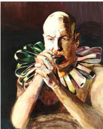
Cornelia Schleime, Schädelwind, 2016, Privatbesitz, © Cornelia Schleime