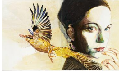
Cornelia Schleime, Eisvögelin, 2016, Privatbesitz, © Cornelia Schleime