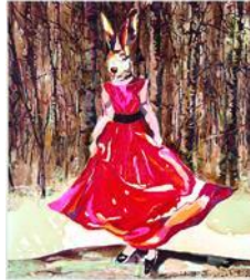
Cornelia Schleime, Blind Date, 2007, Privatbesitz, © Cornelia Schleime, Repro: Bernd Borchardt