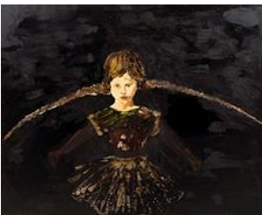
Cornelia Schleime, Die Nacht hat Flügel, 1996, Berlinische Galerie, © Cornelia Schleime