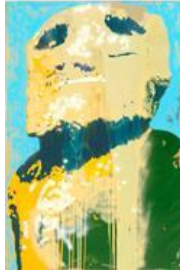
Tatjana Doll, DUMMY_Akku Akku (Green), 2014, © VG BILD-KUNST Bonn, 2016