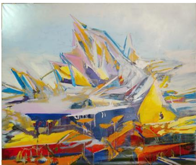
Tatjana Doll, RIP_Self Transforming Machine Elves II, 2013–2015, Privatbesitz, © VG BILD-KUNST Bonn, 2016, Repr: Bernd Borchardt

Super-8-Filme im IBB-Videoraum: Vom 30.11.2016 bis 02.01.2017 werden die zwischen 1982 und 1984 entstandenen vier Super-8-Filme Cornelia Schleimes im IBB-Videoraum der Berlinischen Galerie gezeigt. Mit freundlicher Unterstützung der Investitionsbank Berlin.