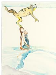
Cornelia Schleime, Die mit dem Frosch tanzt, 2011, Berlinische Galerie, © Cornelia Schleime