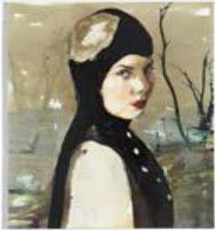
Cornelia Schleime, Die Argonautin, 2015, Privatbesitz, © Cornelia Schleime, Repro: Bernd Borchardt