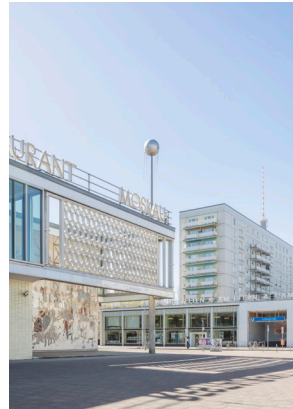
Schnepf Renou, Café Moskau Pavillon, 2026, © Schnepf Renou