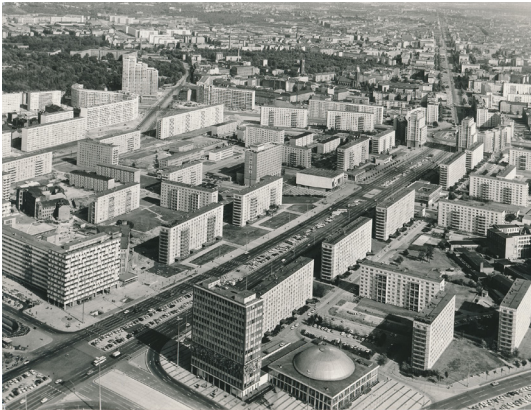
Rolf Vetter, Karl-Marx-Allee zwischen Alexanderplatz und Strausberger Platz, 1970, © IRS Erkner, Foto: Rolf Vetter