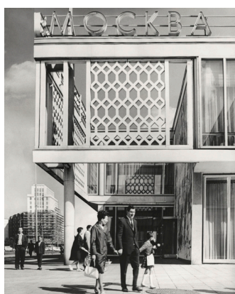
Unbekannte*r Fotograf*in, Restaurant Moskau mit Strausberger Platz, um 1965, © Berlinische Galerie, Digitalisat: A. E. Witte