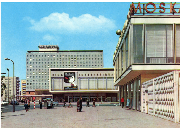
Postkarte, Karl-Marx-Allee Berlin mit dem Ensemble Kino International, entworfen von Josef Kaiser und Heinz Aust, Hotel Berolina, entworfen von Josef Kaiser und Günter Kunert, sowie Restaurant Moskau, entworfen von Josef Kaiser und Horst Bauer, 1964, © Foto Schlegel, Digitalisat: A. E. Witte