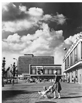
Dieter Urbach, Hotel Berolina und Kino International, 1966