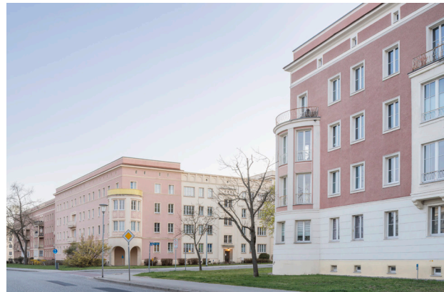
Schnepf Renou, Eisenhüttenstadt, Wohnkomplex II, 2026, © Schnepf Renou