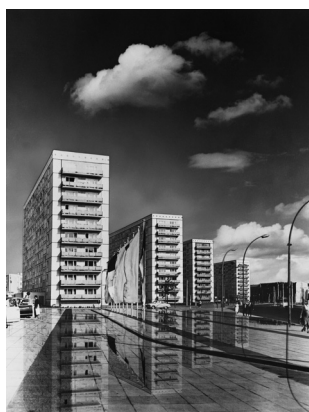
Dieter Urbach, Die Plattenbauten Alexanderstraße, Collage, um 1965