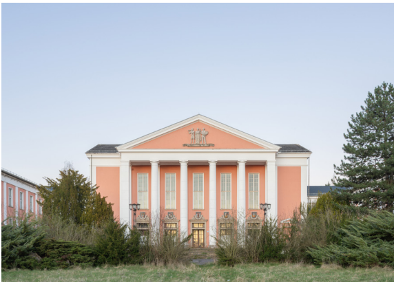
Schnepf Renou, Kulturhaus Maxhütte, 2026