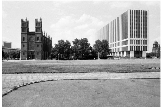
Gerd Danigel, Ministerium für Auswärtige Angelegenheiten der DDR, 1990, © Gerd Danigel