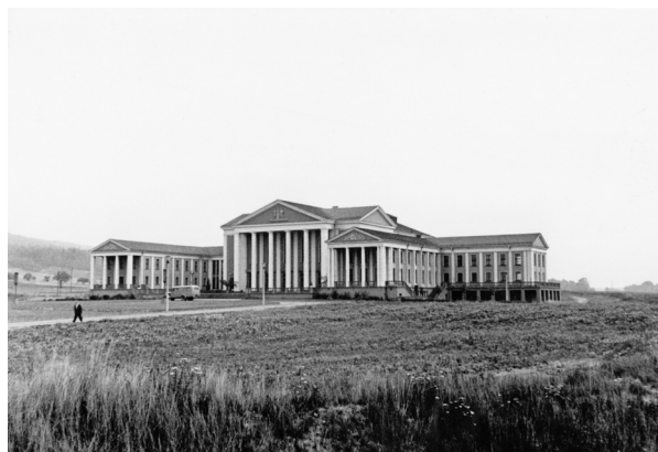
Kulturhaus Maxhütte, um 1955