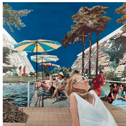
Dieter Urbach, Großhügelhaus, 1971