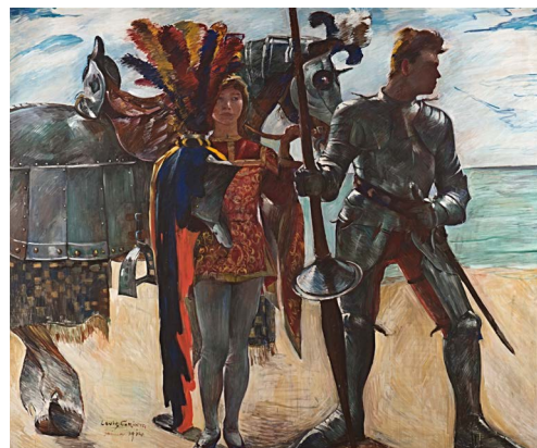
Lovis Corinth, Ruggiero und Knappe, aus dem elfteiligen Katzenellenbogen-Zyklus, 1914, 227 x 273 cm, Urheberrechte am Werk erloschen