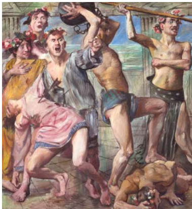
Lovis Corinth, Die Freier im Kampf gegen Odysseus, aus dem elfteiligen Katzenellenbogen-Zyklus, 1913, 227 x 213 cm, Urheberrechte am Werk erloschen, Foto: © Berlinische Galerie