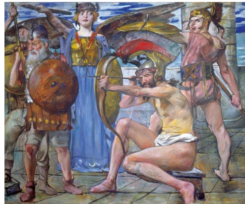
Lovis Corinth, Odysseus im Kampf mit den Freiern, aus dem elfteiligen Katzenellenbogen-Zyklus, 1913, 227 x 273 cm, Urheberrechte am Werk erloschen, Foto: © Berlinische Galerie