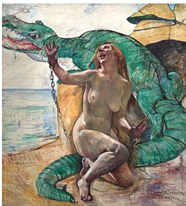
Lovis Corinth, Angelica mit Drachen, aus dem elfteiligen Katzenellenbogen-Zyklus, 1914, 227 x 209 cm, Urheberrechte am Werk erloschen, Foto: © Berlinische Galerie