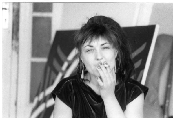
Käthe Kruse im Atelier, Künstlerhaus Bethanien, 1985