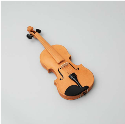
Käthe Kruse, In Leder, 2023, © VG Bild-Kunst, Bonn 2024