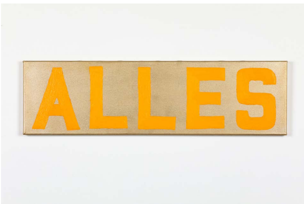
Käthe Kruse, Jetzt ist alles gut, 2024, © VG Bild-Kunst, Bonn 2024, Foto: Christine Fenzl