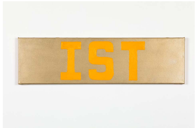
Käthe Kruse, Jetzt ist alles gut, 2024, © VG Bild-Kunst, Bonn 2024, Foto: Christine Fenzl