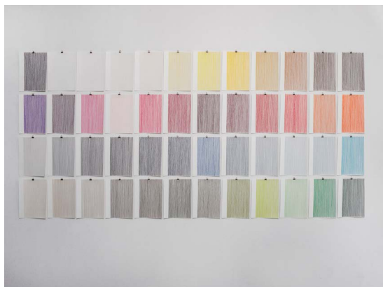
Käthe Kruse, 48 Farben, 2021-2022