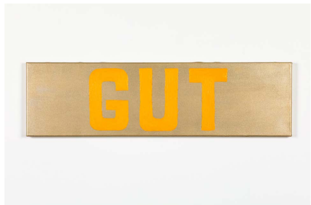
Käthe Kruse, Jetzt ist alles gut, 2024, © VG Bild-Kunst, Bonn 2024, Foto: Christine Fenzl