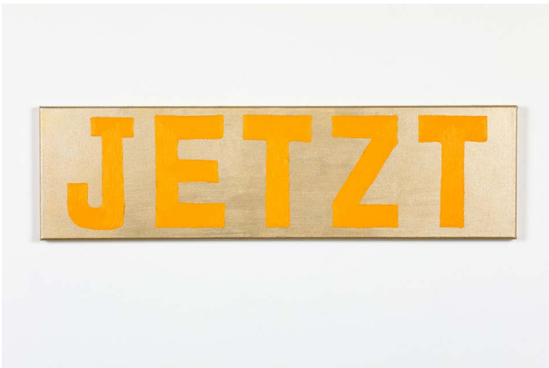
Käthe Kruse, Jetzt ist alles gut, 2024, © VG Bild-Kunst, Bonn 2024