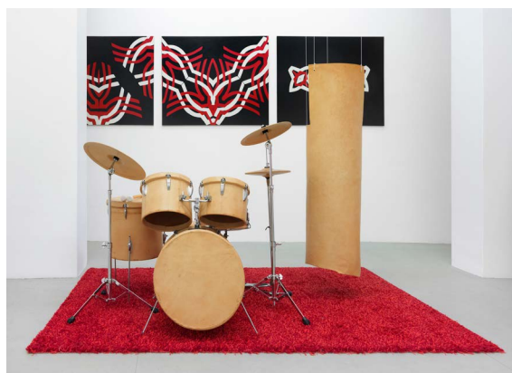
Käthe Kruse, In Leder, 2013, © VG Bild-Kunst, Bonn 2024