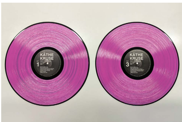
Käthe Kruse, Unhörbar, 2023, © VG Bild-Kunst, Bonn 2024