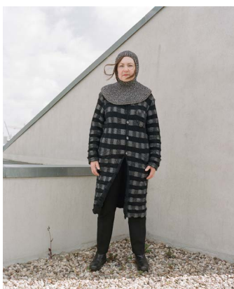
Käthe Kruse, 2021, Foto: Sibylle Fendt / Ostkreuz