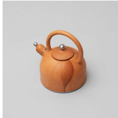
Käthe Kruse, In Leder, 2023, © VG Bild-Kunst, Bonn 2024