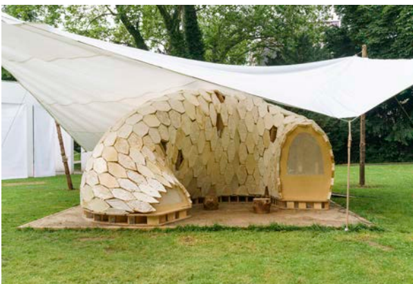
MY-CO-X, MY-CO Space, 2021 © tinyBE, 2021, Foto: Wolfgang Günzel