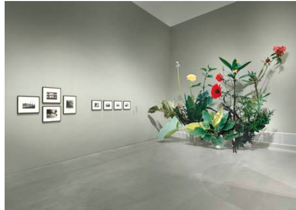
Ausstellungsansicht „Closer to Nature. Bauen mit Pilz, Baum, Lehm“, Berlinische Galerie