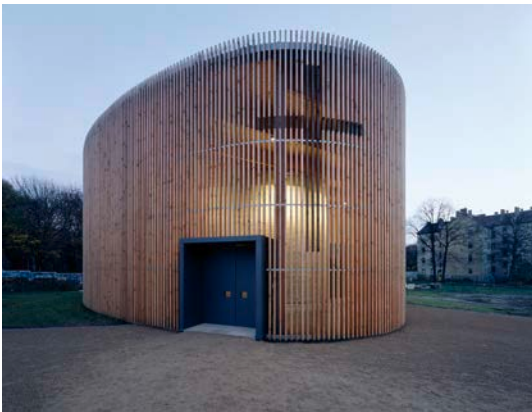
Reitermann / Sassenroth, Kapelle der Versöhnung, 1996–2000 © Reitermann / Sassenroth, Foto: Bruno Klomfar