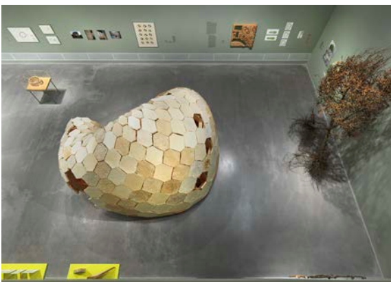
Ausstellungsansicht „Closer to Nature. Bauen mit Pilz, Baum, Lehm“, Berlinische Galerie