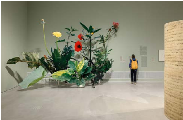
Ausstellungsansicht „Closer to Nature. Bauen mit Pilz, Baum, Lehm“ (abgebildetes Werk: Thomas Eller, THE Selbst mit großem Rasenstück, 1992), Berlinische Galerie