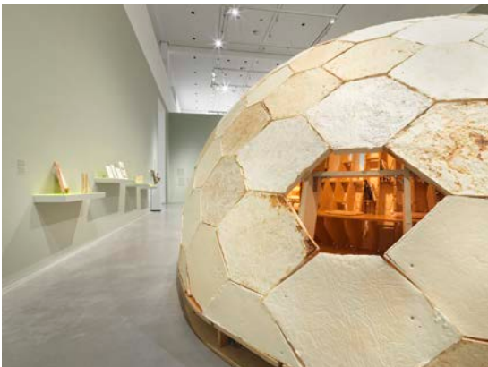
Ausstellungsansicht „Closer to Nature. Bauen mit Pilz, Baum, Lehm“, Berlinische Galerie