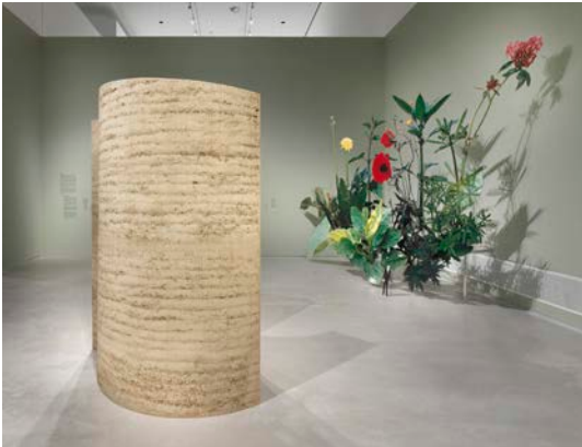
Ausstellungsansicht „Closer to Nature. Bauen mit Pilz, Baum, Lehm“, Berlinische Galerie