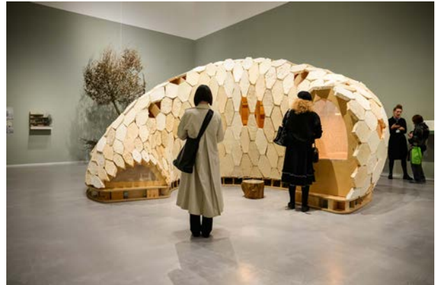
Ausstellungsansicht „Closer to Nature. Bauen mit Pilz, Baum, Lehm“, Berlinische Galerie