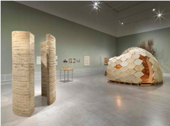
Ausstellungsansicht „Closer to Nature. Bauen mit Pilz, Baum, Lehm“, Berlinische Galerie