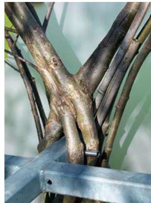
OLA – Office for Living Architecture, Baubotanischer Turm, 2009, Detail 2011