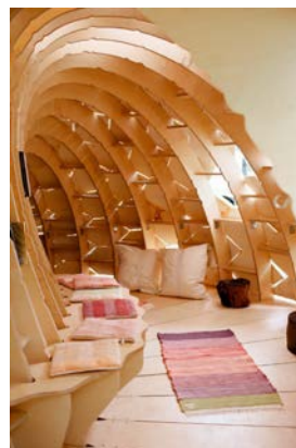
MY-CO-X, MY-CO Space, 2021 © MY-CO-X, Foto: Birke Weber