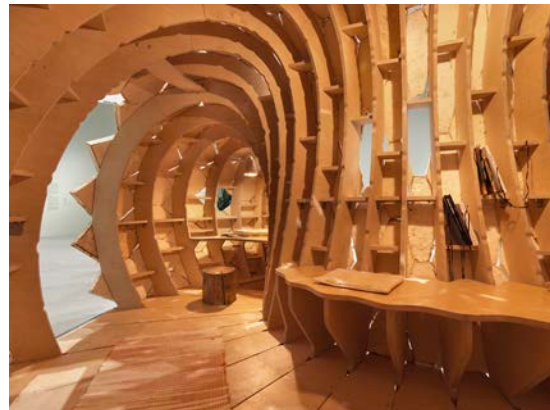
Ausstellungsansicht „Closer to Nature. Bauen mit Pilz, Baum, Lehm“, Berlinische Galerie