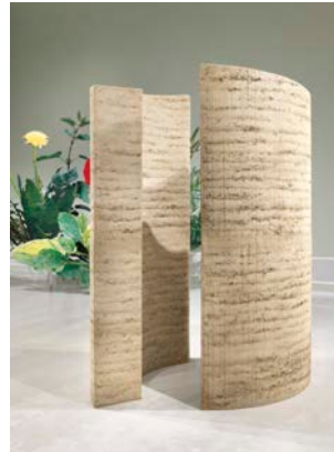
Ausstellungsansicht „Closer to Nature. Bauen mit Pilz, Baum, Lehm“, Berlinische Galerie