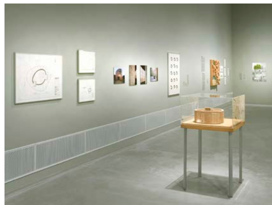
Ausstellungsansicht „Closer to Nature. Bauen mit Pilz, Baum, Lehm“, Berlinische Galerie