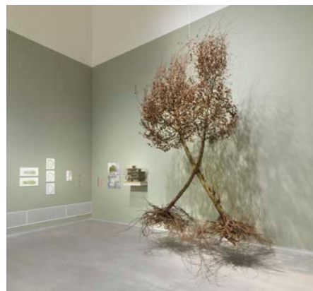
Ausstellungsansicht „Closer to Nature. Bauen mit Pilz, Baum, Lehm“, Berlinische Galerie