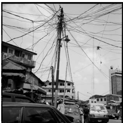
Akinbode Akinbiyi, Popo Aguada, Lagos Island, Lagos, 2006, Aus der Serie: „Lagos: All Roads“, seit den 1980er Jahren, © Akinbode Akinbiyi