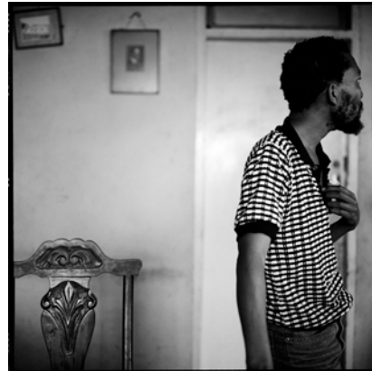
Akinbode Akinbiyi, Durban, 1933, Aus der Serie: „eThekwini“, © Akinbode Akinbiyi