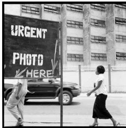
Akinbode Akinbiyi, Victoria Islands, Lagos, 2006, Aus der Serie: „Photography, Tobacco, Sweets, Condoms and other Configurations“, seit den 1970er Jahren, © Akinbode Akinbiyi