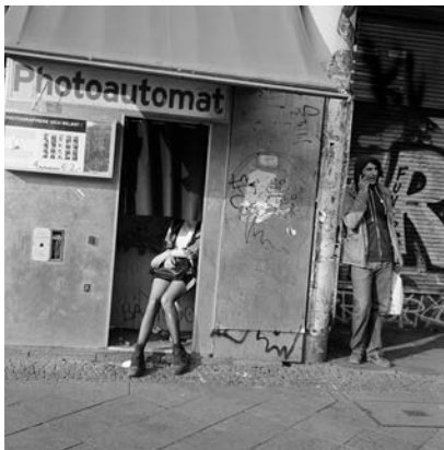
Akinbode Akinbiyi, Kreuzberg, Berlin, 2016, Aus der Serie: „Photography, Tobacco, Sweets, Condoms and other Configurations“, seit den 1970er Jahren