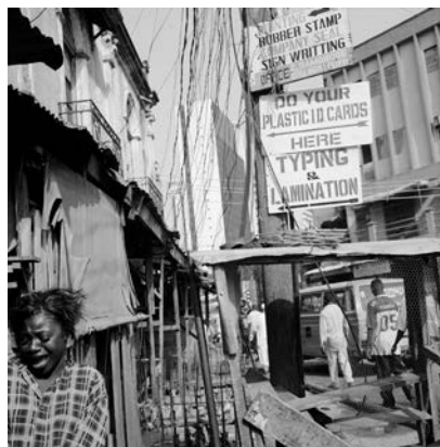
Akinbode Akinbiyi, Lagos Island, Lagos, 2004, Aus der Serie: „Lagos: All Roads“, seit den 1980er Jahren, © Akinbode Akinbiyi