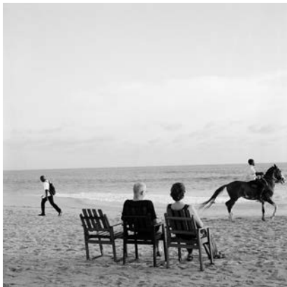
Akinbode Akinbiyi, Bar Beach, Victoria Island, 1999, Aus der Serie: „Sea Never Dry“, seit den 1980er Jahren, © Akinbode Akinbiyi