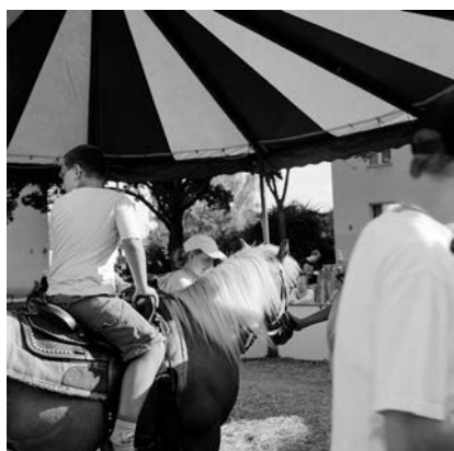
Akinbode Akinbiyi, Wedding, Berlin, 2005, Aus der Serie: „African Quarter“, seit den 1990er Jahren