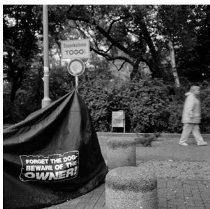
Akinbode Akinbiyi, Wedding, Berlin, 2005, Aus der Serie: „African Quarter“, seit den 1990er Jahren