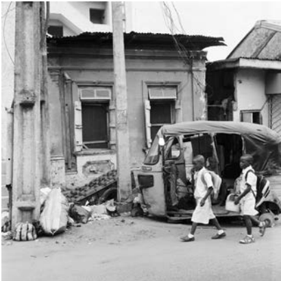
Akinbode Akinbiyi, Lagos Island, Lagos, 2016. Aus der Serie: „Lagos: All Roads“, seit den 1980er Jahren, © Akinbode Akinbiyi