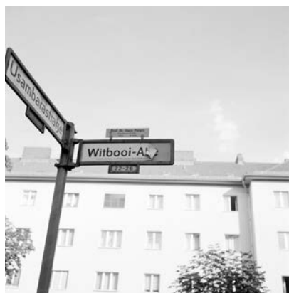
Akinbode Akinbiyi, Wedding, Berlin, 2005, Aus der Serie: „African Quarter“, seit den 1990er Jahren, © Akinbode Akinbiyi