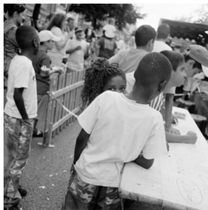
Akinbode Akinbiyi, Wedding, Berlin, 2005, Aus der Serie: „African Quarter“, seit den 1980er Jahren, © Akinbode Akinbiyi

Being, Seeing, Wandering 8.6. – 14.10.24