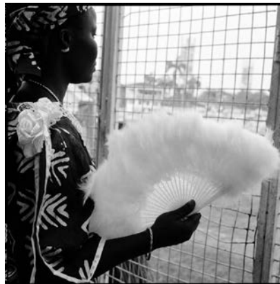
Akinbode Akinbiyi, Lagos Island, Lagos, 2001