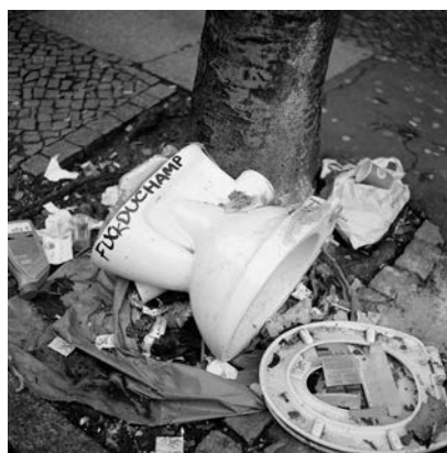
Akinbode Akinbiyi, Neukölln, Berlin, 2019, Aus der Serie: „Photography, Tobacco, Sweets, Condoms and other Configurations“, seit den 1970er Jahren, © Akinbode Akinbiyi