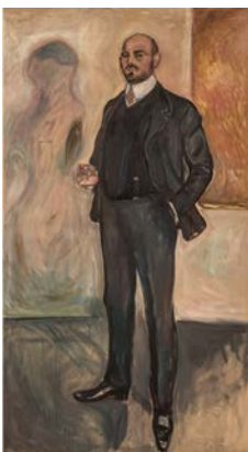
Edvard Munch, Porträt Walther Rathenau, 1907