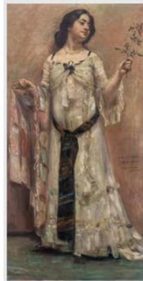
Lovis Corinth, Porträt Charlotte Berend im weißen Kleid, 1902