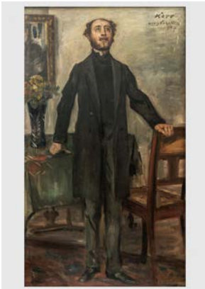
Lovis Corinth, Porträt Alfred Kerr, 1907