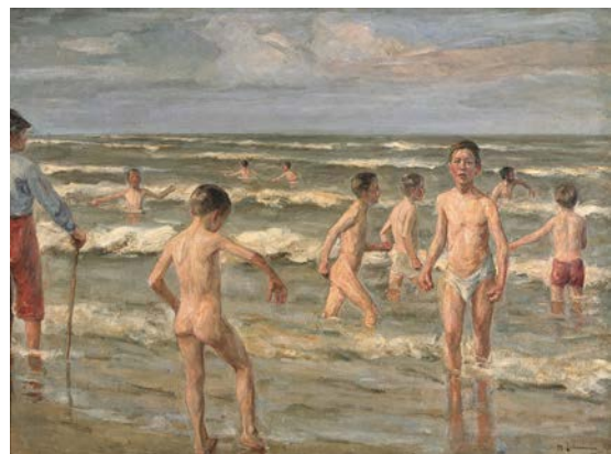
Max Liebermann, Badende Knaben, 1900, © Sammlung Stiftung Stadtmuseum Berlin, Repro: Hans-Joachim Bartsch, Berlin