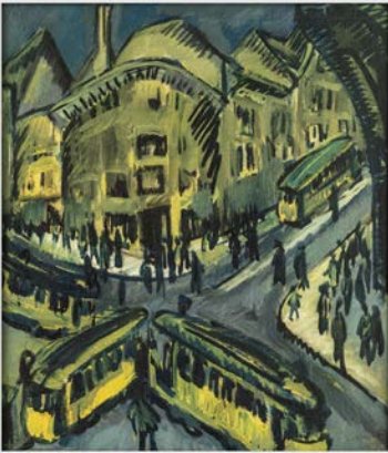
Ernst Ludwig Kirchner, Nollendorfplatz, Berlin, 1912.