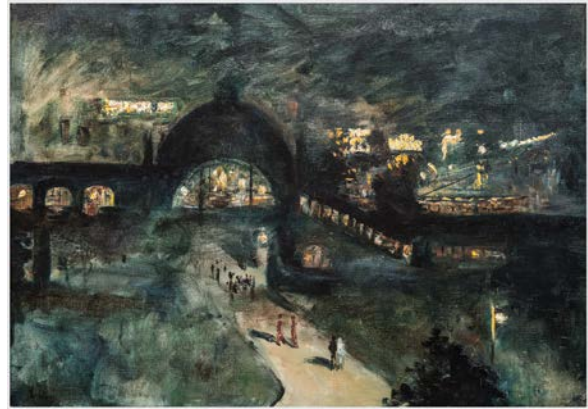
Lesser Ury, Bahnhof Nollendorfplatz bei Nacht, Berlin, 1925.