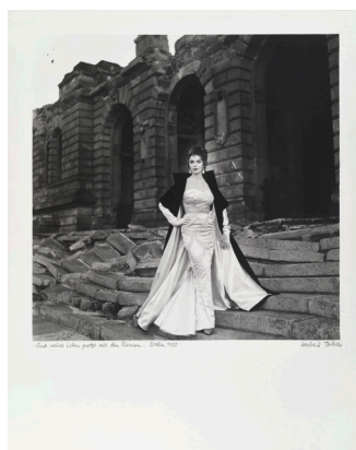
Herbert Tobias, ...und neues Leben protzt aus den Ruinen...Berlin 1958, 1954, © VG Bild-Kunst, Bonn 2021