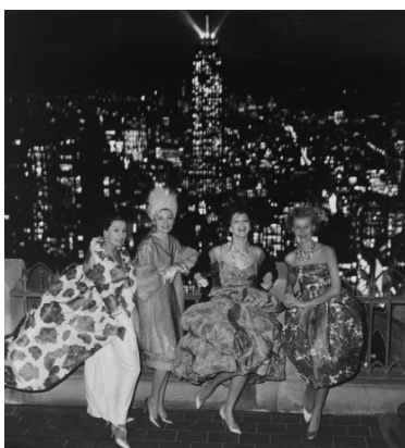
F.C. Gundlach, Berliner Mode, fotografiert auf dem Dach des RCA Building, New York 1958