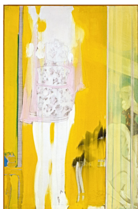
K. H. Hödicke, Negligé, 1965, © VG Bild-Kunst, Bonn 2021