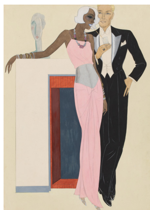
Gerd Hartung, Modezeichnung: Paar in Abendrobe, 1932, © Stiftung Stadtmuseum Berlin, Repro: Michael Setzpfandt, Berlin