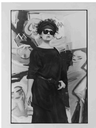
Rolf von Bergmann, Elvira Bach, 1982, © VG Bild-Kunst, Bonn 2021