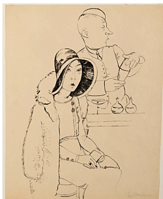
Jeanne Mammen, In der Bar, erschienen in: Simplicissimus , 1930, Jg. 35, Nr. 40, um 1930, © VG Bild-Kunst, Bonn 2021

Fotografie, Malerei und Mode 1900 bis heute 18.2.–30.5.22