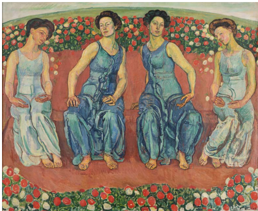
Ferdinand Hodler, Heilige Stunde, 1911, © Stiftung für Kunst, Kultur und Geschichte, Winterthur, Foto: SKKG