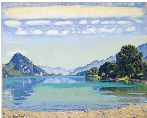
Ferdinand Hodler, Thunersee von Leissigen aus, 1904