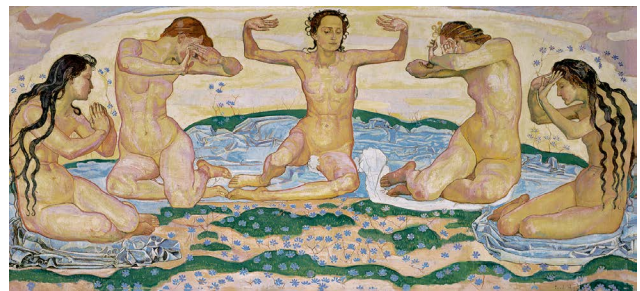
Ferdinand Hodler, Der Tag, 1899-1900