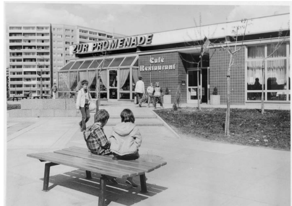
Marzahn Promenade, Café Restaurant „Zur Promenade“, Entwurf: Büro Eisentraut im IHB, nach 1985, Foto: © Unbekannte*r Fotograf*in / Berlinische Galerie, Digitalisierung: Anja Elisabeth Witte