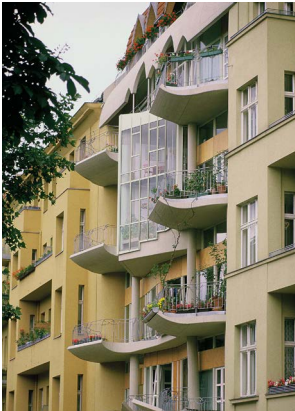
Hinrich und Inken Baller, Torhaus am Fraenkelufer, 1984.