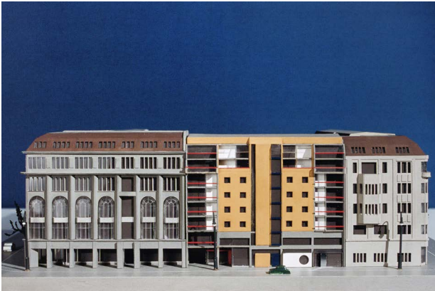
Baudirektion Hauptstadt Berlin (Ost) VEB Berlin-Projekt, Modellwerkstatt IHB, Betrieb Projektierung Friedrichstraße Nord, Spreeterrassen von Karl-Ernst Swora – Ansicht Spree, 1987