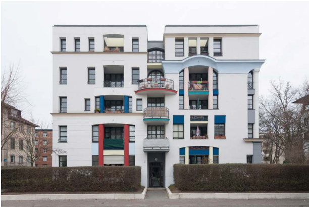
Rob Krier, Stadtvilla Rauchstraße 6, Foto: © Thomas Bomm, 2018