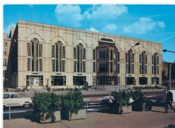
Ansichtskarte Friedrichstadtpalast Berlin, 1981–1984, Foto: © Unbekannte*r Fotograf*in / Berlinische Galerie

BERLINISCHE GALERIE MUSEUM FÜR MODERNE KUNST