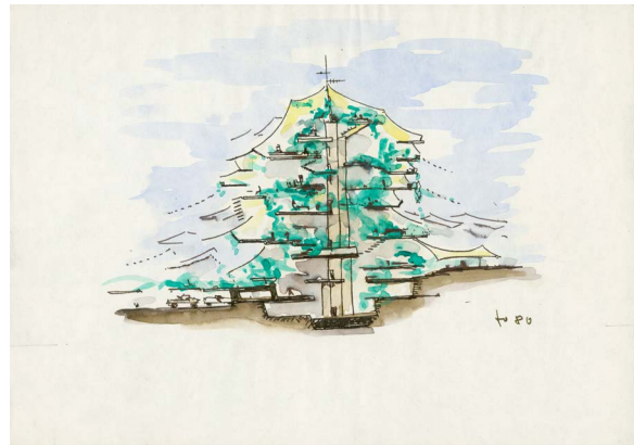
Frei Otto, Ideenskizze für ein Baumhaus, 1980