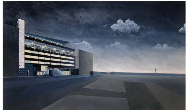
Office for Metropolitan Architecture (OMA), Elia Zenghelis, Zoe Zenghelis, Wohnhaus am Checkpoint Charlie, Außenperspektive, 1987, Sammlung Deutsches Architekturmuseum, Frankfurt am Main