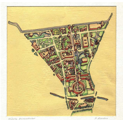
Peter Riemann, Konzept Südliche Friedrichstadt, Cornell Sommerakademie für Berlin, 1977, © Peter Riemann