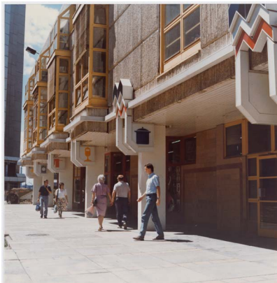
Kaufhaus am Marzahn Tor, Entwurf: Büro Eisentraut im IHB, um 1988, Foto: © Unbekannte*r Fotograf*in / Berlinische Galerie, Digitalisierung: Anja Elisabeth Witte