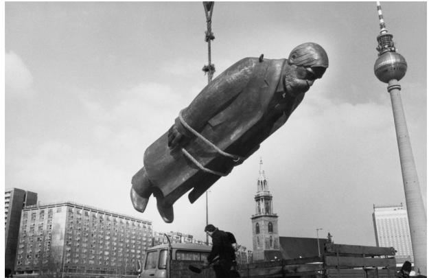
Sibylle Bergemann, Aus der Serie Das Denkmal, 1986, Dokumentation vom Aufbau des Marx-Engels-Forums auf Usedom und in Berlin, 1975–1986 © Nachlass Sibylle Bergemann, OSTKREUZ; Courtesy Look Galerie, Berlin