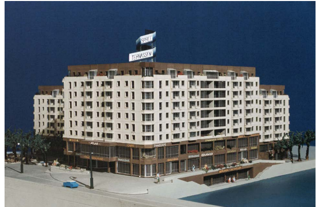
Baudirektion Hauptstadt Berlin (Ost) VEB Berlin-Projekt, Modellwerkstatt IHB, Betrieb Projektierung Friedrichstraße Nord, Spreeterrassen – Ansicht Spree, 1987