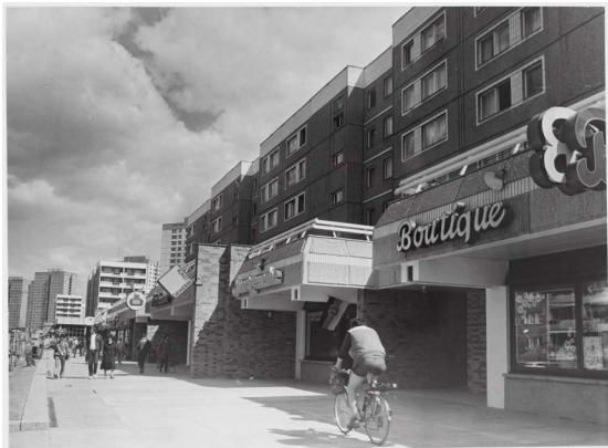
Marzahn Promenade, Entwurf: Büro Eisentraut im IHB, 1980er Jahre, Foto: © Unbekannte*r Fotograf*in / Berlinische Galerie, Digitalisierung: Anja Elisabeth Witte