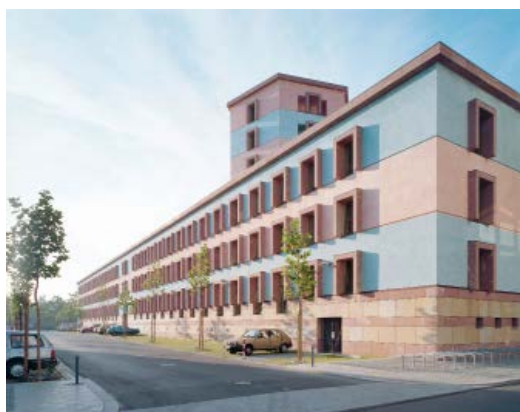
James Stirling, Michael Wilford & Associates, Wissenschaftszentrum Berlin, 1979–1988