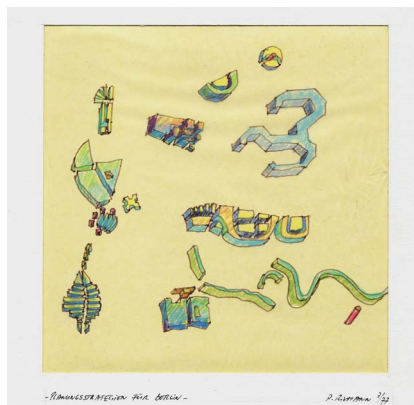
Peter Riemann, Stadtinseln, Cornell Sommerakademie für Berlin, 1977, © Peter Riemann