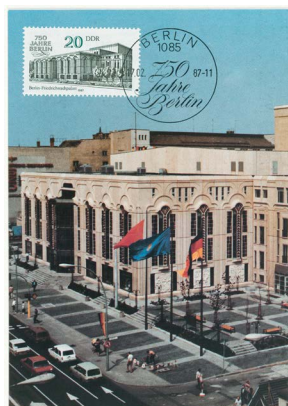
Ansichtskarte „750 Jahre Berlin - Friedrichstadtpalast“, Datum (Poststempel): 17.02.1987, Privatbesitz