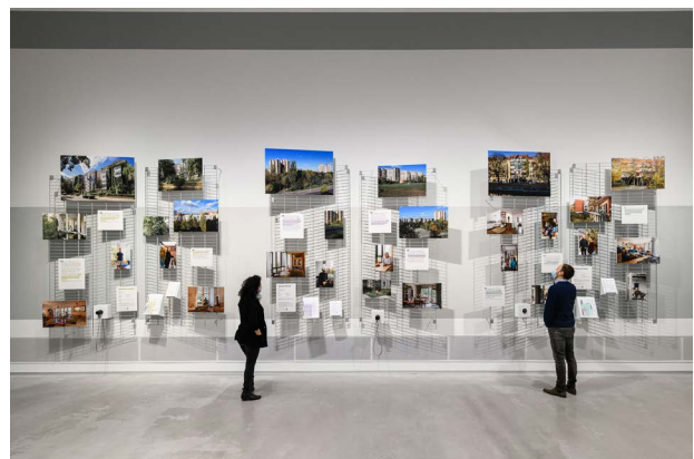
Ausstellungsansicht, Guerilla Architects, „Revisited. Zu Besuch in Wohnhäusern der 80er Jahre“, Foto: © Phil Dera