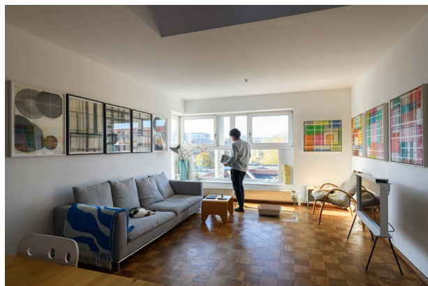
Guerilla Architects, „Revisited. Zu Besuch in Wohnhäusern der 80er Jahre“, Wohnhof LiMa, Foto: © Phil Dera

Ein Projekt der Guerilla Architects anlässlich der Ausstellung Anything Goes? Berliner Architekturen der 1980er Jahre