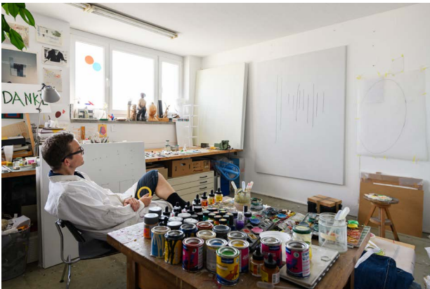
Guerilla Architects, „Revisited. Zu Besuch in Wohnhäusern der 80er Jahre“, Spittleck