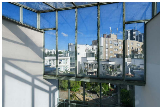
Guerilla Architects, „Revisited. Zu Besuch in Wohnhäusern der 80er Jahre“, Wohnhof LiMa