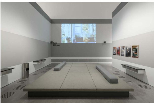
Ausstellungsansicht, Guerilla Architects, „Revisited. Zu Besuch in Wohnhäusern der 80er Jahre“