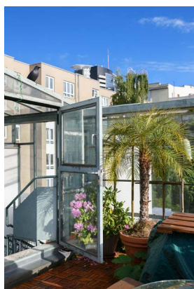
Guerilla Architects, „Revisited. Zu Besuch in Wohnhäusern der 80er Jahre“, Wohnhof LiMa