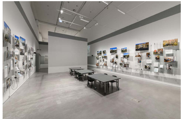
Ausstellungsansicht, Guerilla Architects, „Revisited. Zu Besuch in Wohnhäusern der 80er Jahre“, Foto: © Phil Dera