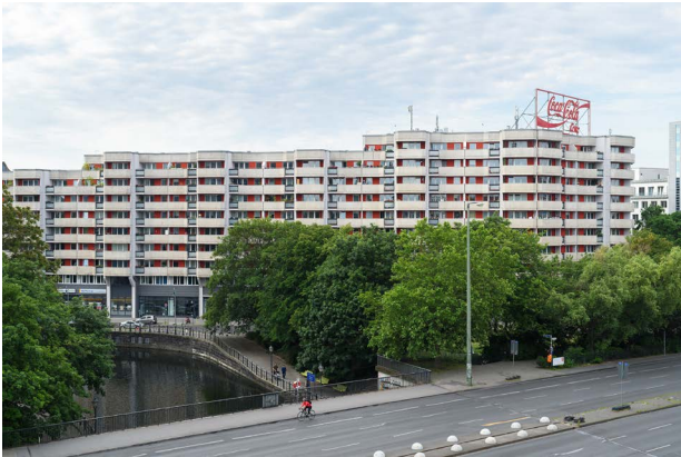
Guerilla Architects, „Revisited. Zu Besuch in Wohnhäusern der 80er Jahre“, Spittleck