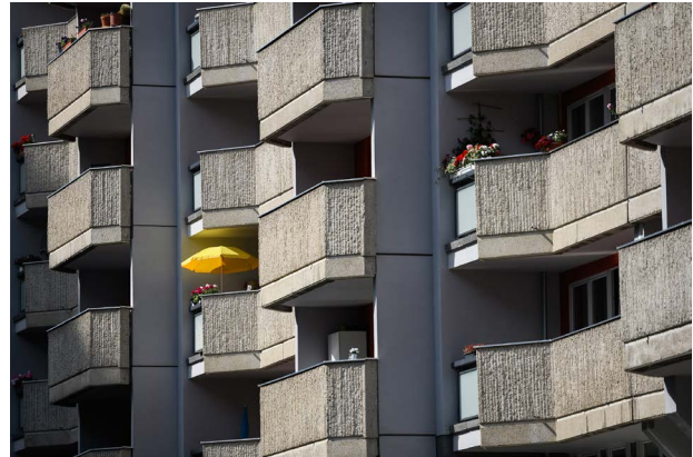
Guerilla Architects, „Revisited. Zu Besuch in Wohnhäusern der 80er Jahre“, Spittleck, Foto: © Phil Dera