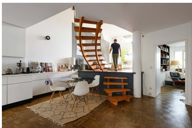
Guerilla Architects, „Revisited. Zu Besuch in Wohnhäusern der 80er Jahre“, Fraenkelufer, Foto: © Phil Dera