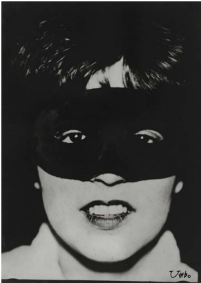
Umbo, Rut Maske, 1927