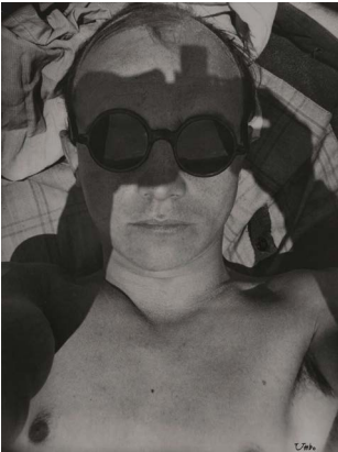
Umbo, Ohne Titel (Selbstporträt), um 1930