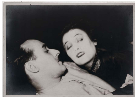
Umbo, Wolpe und Tanja, 1927, 2016 erworben mit Mitteln der Deutschen Klassenlotterie Berlin von der Kulturverwaltung des Berliner Senats und der Beauftragten der Bundesregierung für Kultur und Medien