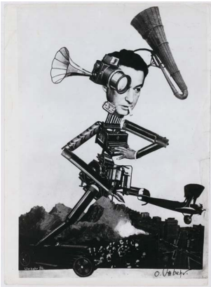
Umbo, Der Rasende Reporter, 1926, erworben mit Unterstützung der Kulturstiftung der Länder, Berlin. Gefördert von der Beauftragten der Bundesregierung für Kultur und Medien aufgrund eines Beschlusses des Deutschen Bundestages