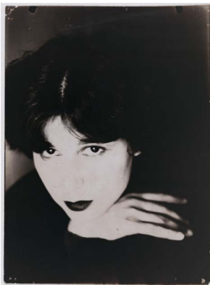
Umbo, Ohne Titel (Ruth. Die Hand), um 1926, 2016 erworben mit Mitteln der Beauftragten der Bundesregierung für Kultur und Medien