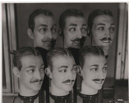
Umbo, Ohne Titel (Menjou en gros), 1928/1929, Leihgabe der Ernst von Siemens Kunststiftung © Phyllis Umbehrr/Galerie Kicken Berlin/VG Bild-Kunst, Bonn 2020, Repr: Anja E. Witte