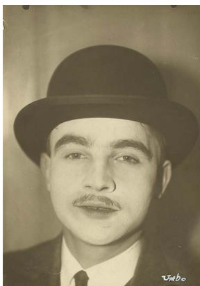
Umbo, Ohne Titel (Selbstporträt), 1926, Stiftung Bauhaus Dessau, 2016 erworben als Teil des Nachlasses des Künstlers aus Mitteln der Kulturstiftung der Länder, des Landes Sachsen-Anhalt, der Wüstenrot Stiftung, der Hermann Reemtsma Stiftung, der Fritz Thyssen Stiftung und von Lotto Sachsen-Anhalt. Gefördert von der Beauftragten der Bundesregierung für Kultur und Medien aufgrund eines Beschlusses des Deutschen Bundestages © Phyllis Umbehrl/Galerie Kicken Berlin/VG Bild-Kunst, Bonn 2020