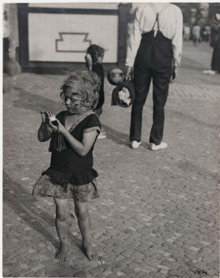
Umbo, Kleines Mädchen, 1928/1929, erworben mit Unterstützung der Kulturstiftung der Länder, Berlin. Gefördert von der Beauftragten der Bundesregierung für Kultur und Medien aufgrund eines Beschlusses des Deutschen Bundestages © Phyllis Umbehr/Galerie Kicken Berlin/VG Bild-Kunst, Bonn 2020