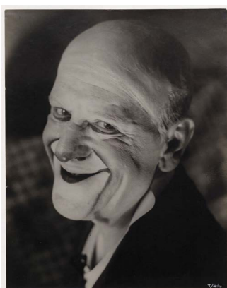
Umbo, Ohne Titel, aus der Reportage „Dr. phil. h. c. Grock“, 1928/1929, Sprengel Museum Hannover, Leihgabe Kunststiftung Bernhard Sprengel und Freunde, Hannover