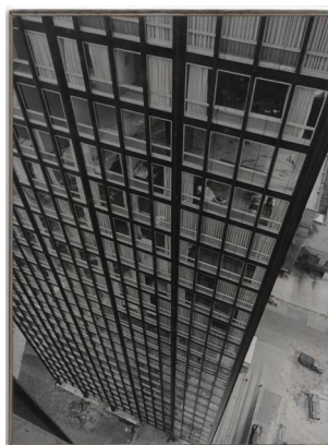
Umbo, Stahl-Appartment-Haus von Architekt Mies van der Rohe in Chicago, Sprengel Museum Hannover, 2016 erworben mit Mitteln der Beauftragten der Bundesregierung für Kultur und Medien, der Kulturstiftung der Länder, der Landeshauptstadt Hannover, des Landes Niedersachsen und der Stiftung Niedersachsen als Teil des Nachlasses des Künstlers