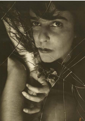
Umbo, Ruth, Spinne, 1927, Stiftung Bauhaus Dessau, 2016 erworben als Teil des Nachlasses des Künstlers aus Mitteln der Kulturstiftung der Länder, des Landes Sachsen-Anhalt, der Wüstenrot Stiftung, der Hermann Reemtsma Stiftung, der Fritz Thyssen Stiftung und von Lotto Sachsen-Anhalt. Gefördert von der Beauftragten der Bundesregierung für Kultur und Medien aufgrund eines Beschlusses des Deutschen Bundestages © Phyllis Umbehr/Galerie Kicken Berlin/VG Bild-Kunst, Bonn 2020