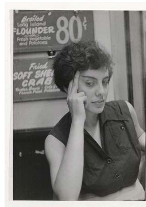
Umbo, Ohne Titel (Frauenporträt auf der Straße), 1952, Sprengel Museum Hannover, 2016 erworben mit Mitteln der Beauftragten der Bundesregierung für Kultur und Medien, der Kulturstiftung der Länder, der Landeshauptstadt Hannover, des Landes Niedersachsen und der Stiftung Niedersachsen als Teil des Nachlasses des Künstlers