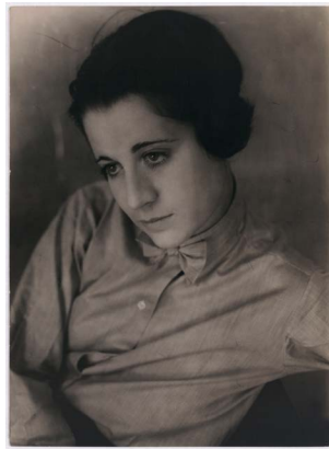
Umbo, Ohne Titel (Porträt), 1927-1930, erworben 2016 aus Haushaltsmitteln der Berlinischen Galerie, Berlin. Gefördert von der Beauftragten der Bundesregierung für Kultur und Medien aufgrund eines Beschlusses des Deutschen Bundestages (Dauerleihgabe)