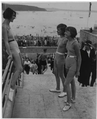
Umbo, Strandbad Wannsee, um 1930 © Phyllis Umbehr/Galerie Kicken Berlin/VG Bild-Kunst, Bonn 2020