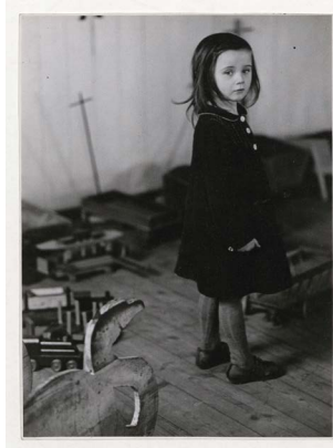
Umbo, Ohne Titel, aus der Reportage „The Lost Child“, 1951, Sprengel Museum Hannover