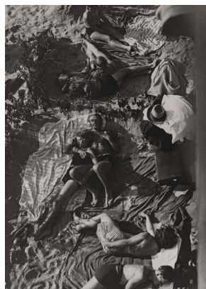
Umbo, Am Strand (auch Strandleben), 1930