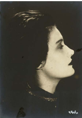
Umbo, Tanja, 1927, Stiftung Bauhaus Dessau, 2016 erworben als Teil des Nachlasses des Künstlers aus Mitteln der Kulturstiftung der Länder, des Landes Sachsen-Anhalt, der Wüstenrot Stiftung, der Hermann Reemtsma Stiftung, der Fritz Thyssen Stiftung und von Lotto Sachsen-Anhalt. Gefördert von der Beauftragten der Bundesregierung für Kultur und Medien aufgrund eines Beschlusses des Deutschen Bundestages