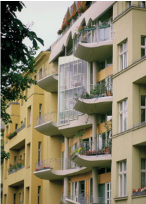
Hinrich und Inken Baller, Torhaus am Fraenkelufer, 1984, Foto: Reinhard Friedrich, © Archiv Hinrich und Inken Baller