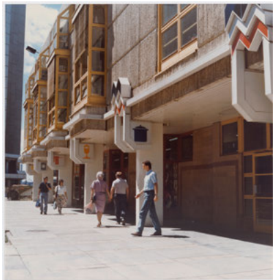
Kaufhaus am Marzahner Tor, Entwurf: Büro Eisentraut im IHB, um 1988, Foto: © Unbekannte*r Fotograf*in / Berlinische Galerie, Digitalisierung: Anja Elisabeth Witte