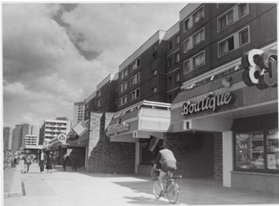
Marzahner Promenade, Entwurf: Büro Eisentraut im IHB, 1980er Jahre, Foto: © Unbekannte*r Fotograf*in / Berlinische Galerie, Digitalisierung: Anja Elisabeth Witte