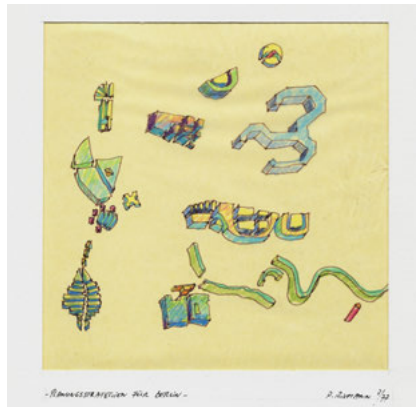
Peter Riemann, Stadtinseln, Cornell Sommerakademie für Berlin, 1977