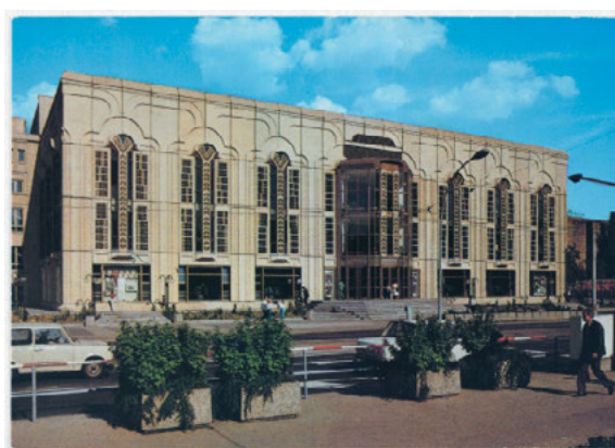
Ansichtskarte Friedrichstadtpalast Berlin, 1981–1984