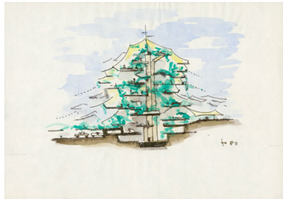
Frei Otto, Ideenskizze für ein Baumhaus, 1980