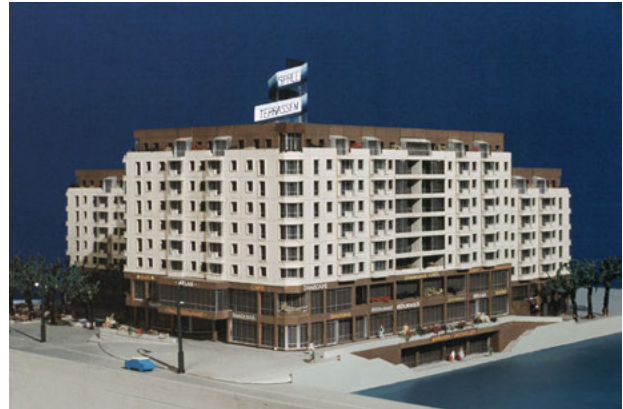
Baudirektion Hauptstadt Berlin (Ost) VEB Berlin-Projekt, Modellwerkstatt IHB, Betrieb Projektierung Friedrichstraße Nord, Spreeerrassen – Ansicht Spree, 1987