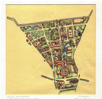
Peter Riemann, Konzept Südliche Friedrichstadt, Cornell Sommerakademie für Berlin, 1977, © Peter Riemann