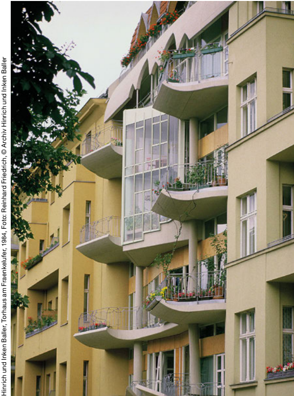
Hinrich und Inken Baller, Torhaus am Fraenkelufer, 1984, Foto: Reinhard Friedrich, © Archiv Hinrich und Inken Baller