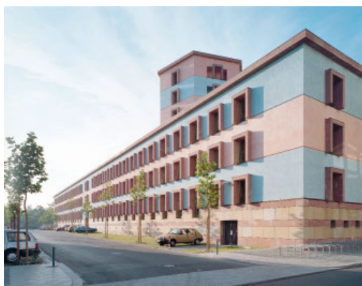
James Stirling, Michael Wilford & Associates, Wissenschaftszentrum Berlin, 1979–1988