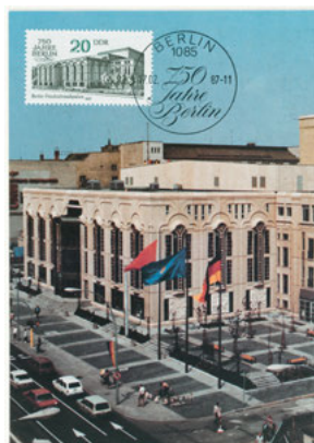
Ansichtskarte „750 Jahre Berlin - Friedrichstadtpalast“, Datum (Poststempel): 17.02.1987, Privatbesitz