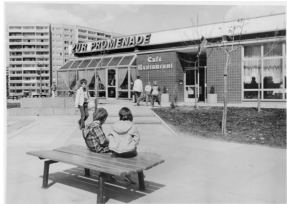
Marzahner Promenade, Café Restaurant „Zur Promenade“, Entwurf: Büro Eisentraut im IHB, nach 1985, Foto: © Unbekannte*r Fotograf*in / Berlinische Galerie, Digitalisierung: Anja Elisabeth Witte