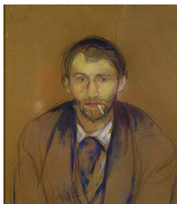
Edvard Munch, Stanislaw Przybyszewski, 1895