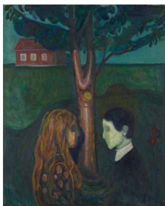
Edvard Munch, Auge in Auge, 1899-1900