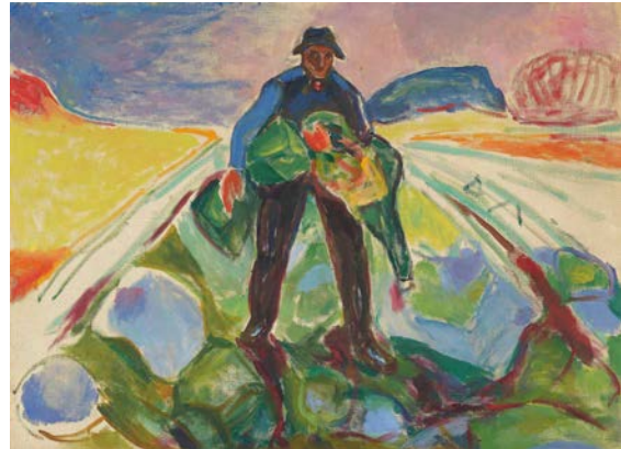
Edvard Munch, Der Mann im Kohlacker, 1943