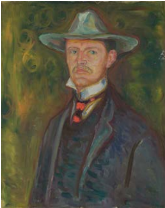
Edvard Munch, Selbstporträt mit breitkrepigem Hut, 1905–1906