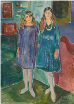
Edvard Munch, Zwei Backfische, 1919