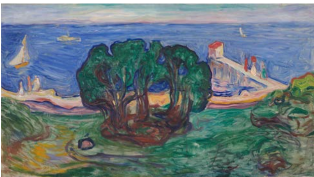
Edvard Munch, Baumgruppe am Strand (Der Linde-Fries), 1904