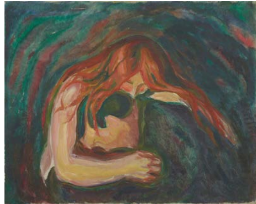
Edvard Munch, Vampir, 1916–1918