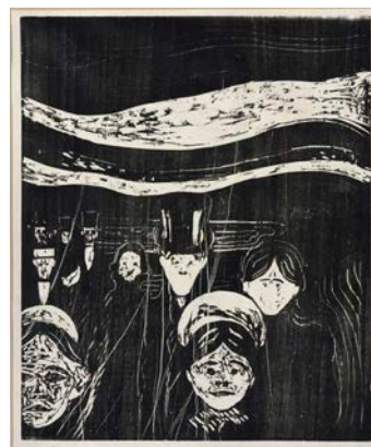
Edvard Munch, Angst (Angstgefühl), 1896