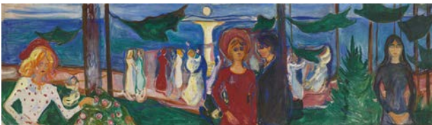
Edvard Munch, Tanz am Strand (Linde-Fries), 1904