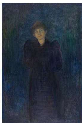
Edvard Munch, Dagny Juel Przybyszewska, 1893