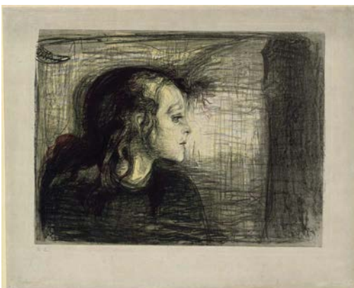
Edvard Munch, Das kranke Kind I, 1896