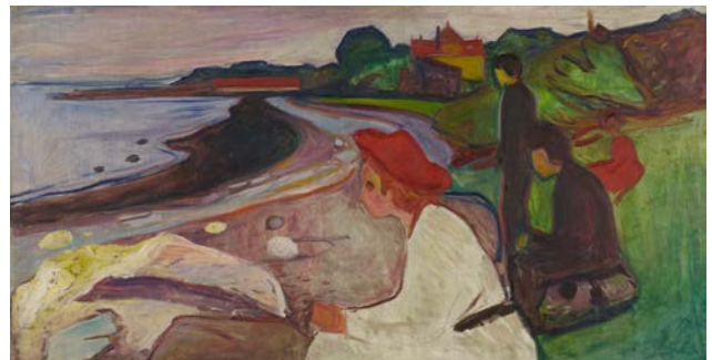
Edvard Munch, Jugend am Strand (Der Linde-Fries), 1904