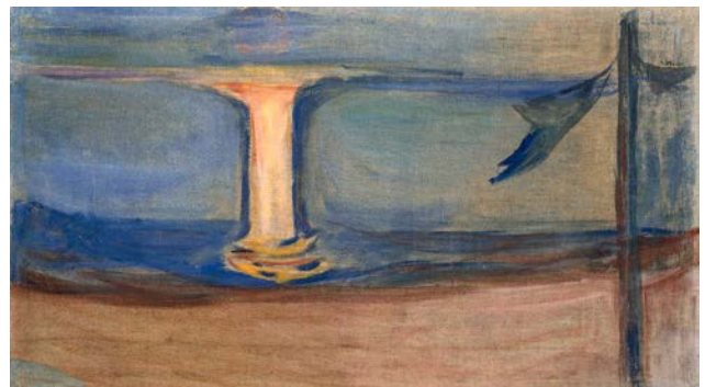
Edvard Munch, Mondschein auf dem Meer (Der Reinhardt-Fries), 1906-1907