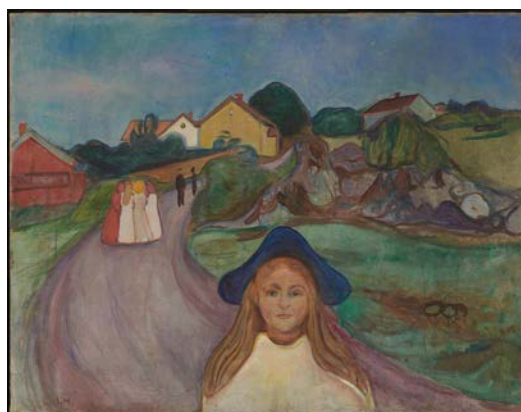
Edvard Munch, Straße in Åsgårdstrand, 1901