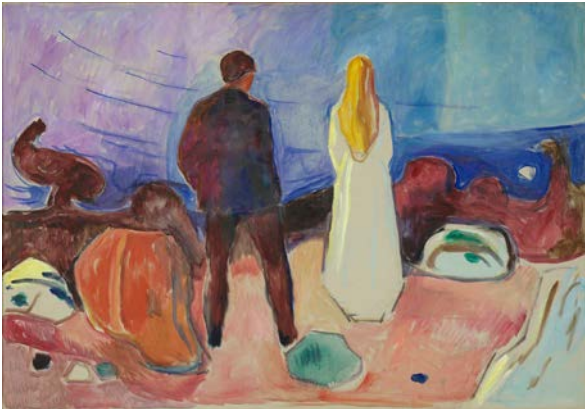
Edvard Munch, Zwei Menschen (Die Einsamen), um 1935