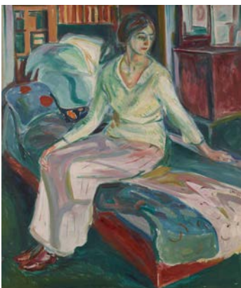
Edvard Munch, Sitzendes Modell auf dem Diwan, 1924–1926