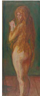
Edvard Munch, Akt mit langem roten Haar, 1902