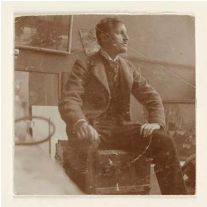
Edvard Munch, Selbstporträt auf einem Reisekoffer im Atelier, Lützowstraße 82, Berlin, 1902