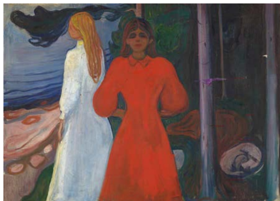
Edvard Munch, Rot und Weiß, 1899-1900