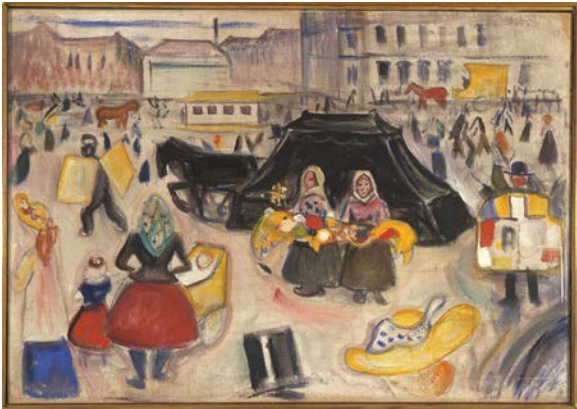
Edvard Munch, Leichenwagen auf dem Potsdamer Platz, 1902