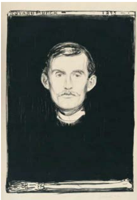
Edvard Munch, Selbstbildnis (mit skelettiertem Arm), 1895