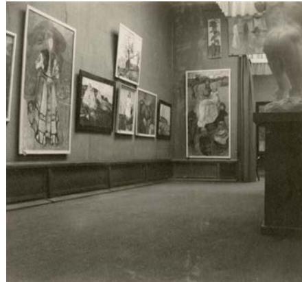
Edvard Munchs Ausstellung bei Paul Cassirer, Berlin, 1907