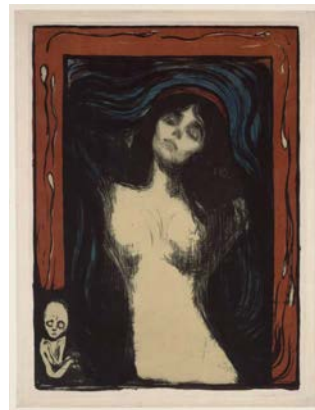
Edvard Munch, Madonna (Liebende Frau), 1895/1902