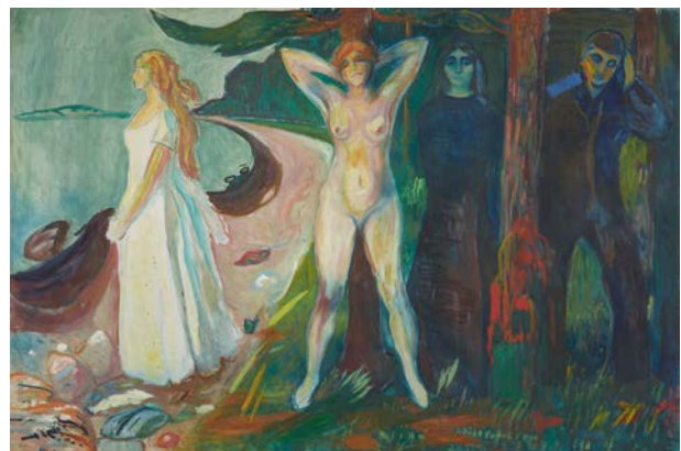
Edvard Munch, Die Frau, 1925